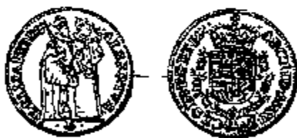
Albrecht en Isabella 2/3 Souverain Brussel

Het muntgewicht voor de 2/3 soeverein van Albrecht en Isabella, dat zich in de kleine doos van Sprinant bevindt, verdient nadere aandacht. Van deze zeer zeldzame munt, met een gewicht van 3,49 gram, een goudgehalte van 980 duizendsten en een omloopwaarde van vier gulden, werd slechts een zeer klein aantal exemplaren geslagen (11).