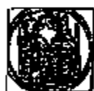
Dubbele souverein (Albrecht & Isabella)